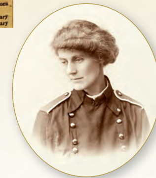
An Chuntaois de Markievicz

Is í an Chuntaois de Markievicz an chéad bhean a thoghtar chun Teach na dTeachtaí riamh