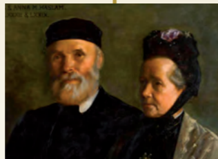
Thomas agus Anna Haslam

Bunaítear Cumann Bhaile Átha Cliath um Cheart Vótála do Mhná