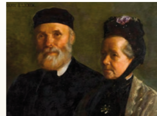
Thomas agus Anna Haslam

Rinne mná feachtasaíocht freisin ar son feabhsuithe eile ar a gcearta, agus d'éirigh níos fearr leis na hiarrachtaí sin. Ó na 1870í ar aghaidh, bhí cead ag mná pósta úinéireacht a bheith acu ar mhaoin. Bhí cead ag mná a raibh méid áirithe maoinne acu páirt a ghlacadh sa rialtas áitiúil. Sa bhliain 1878, tugadh cead do chailíní scoile scrúduithe poiblí a dhéanamh. Thosaigh scoileanna leighis ag glacadh le mná agus, faoi na chéad deich mbliana den fhichiú haois, bhí cead ag mná freastal ar an ollscoil.