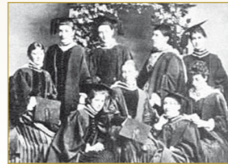
Baineann na chéad mhná céim amach in ollscoil Éireannach

Rinne sufragóirí feachtasaíocht chun go gcuirfí na mná san áireamh sa chéad sraith eile d'athchóirithe toghcháin. D'eagraigh siad cruinnithe poiblí agus cruinnithe príobháideacha, thug siad cuireadh do chainteoirí ó Shasana agus scríobh siad litreacha chuig polaiteoirí. Ach ritheadh an Third Reform Act in 1884 gan aon chearta vótála a thabhairt do mhná.