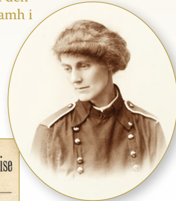
An Chuntaois de Markievicz