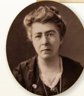
Hanna Sheehy Skeffington

Ina theannta sin, ba í 1918 an bhliain ar toghadh bean chun Parlaimint na Breataine in Westminster den chéad uair.