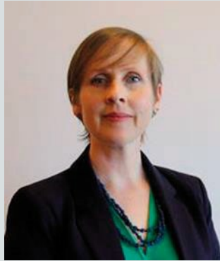
An Seanadóir Pauline O'Reilly An Comhaontas Glas