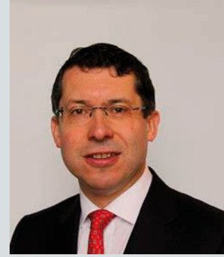
An Seanadóir Rónán Mullen Neamhspleách