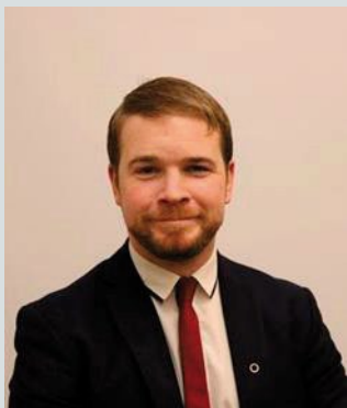
Donnchadh Ó Laoghaire TD Sinn Féin