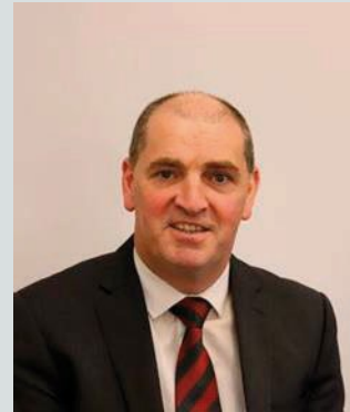
Paul Kehoe TD Fine Gael (Cathaoirleach)