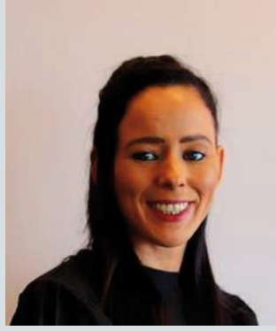
An Seanadóir Eileen Flynn Neamhspleách