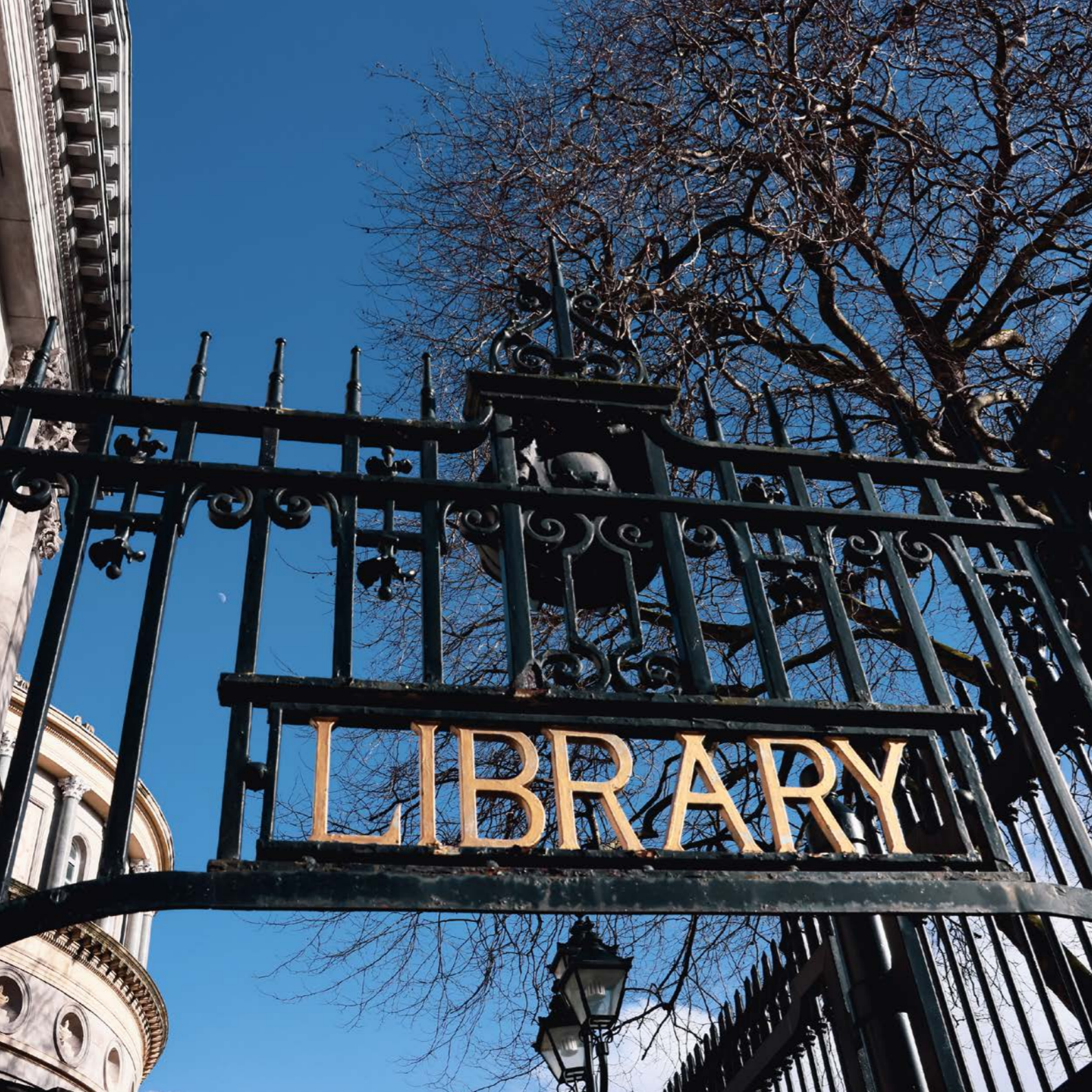
Íomhá: Bealach isteach chuig Leabharlann Náisiúnta na hÉireann