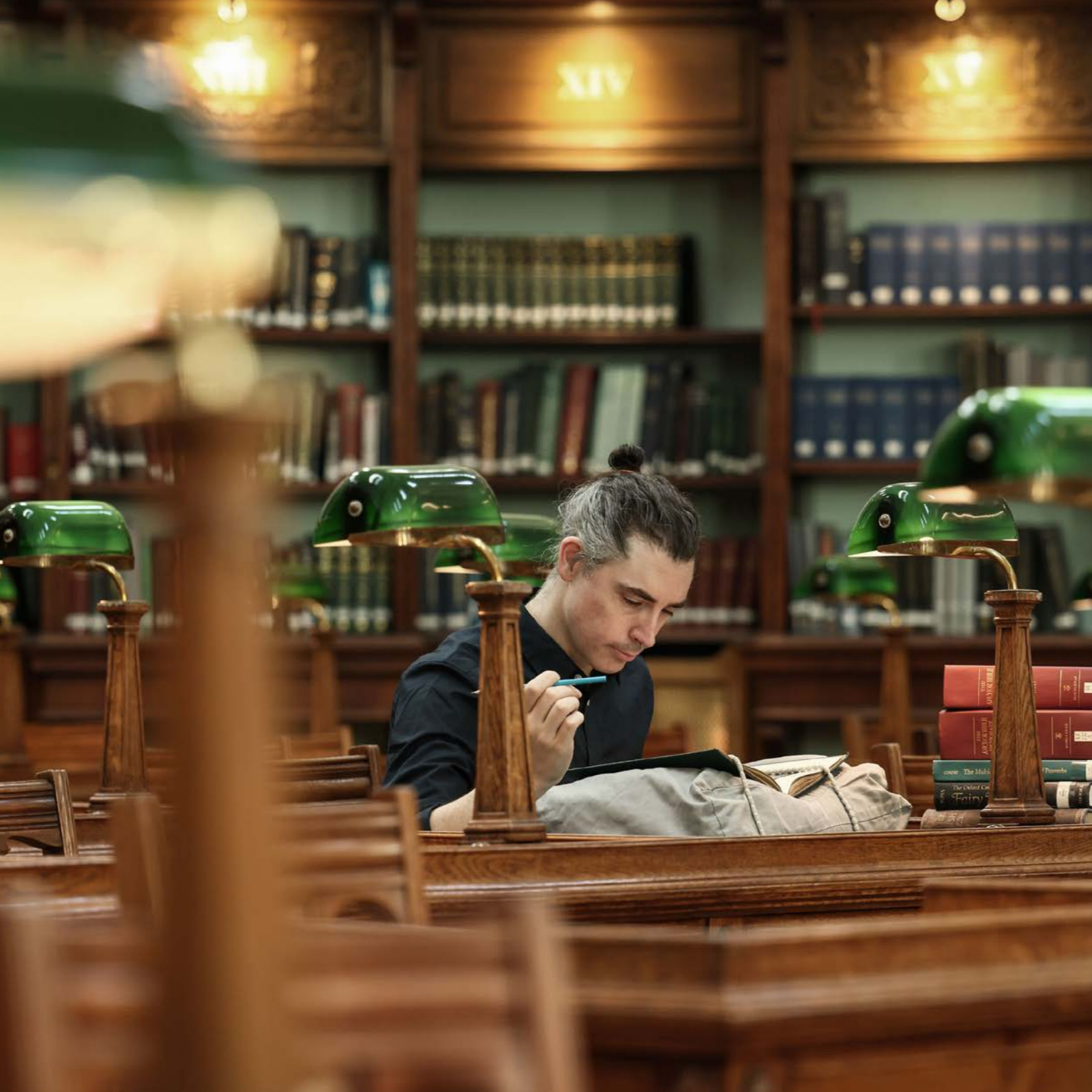
Íomhá: Ag dul i gcomhairle le hábhar i Seomra Léitheoireachta Leabharlann Náisiúnta na hÉireann