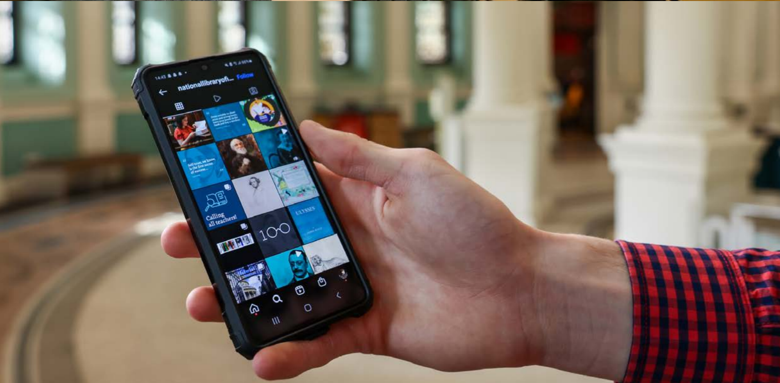
íomhá 1: Tús le taighde ar stair teaghlaigh ar shuíomh gréasáin Leabharlann Náisiúnta na hÉireann; íomhá 2: Ag féachaint ar chuntas Instagram Leabharlann Náisiúnta na hÉireann ar fhón póca