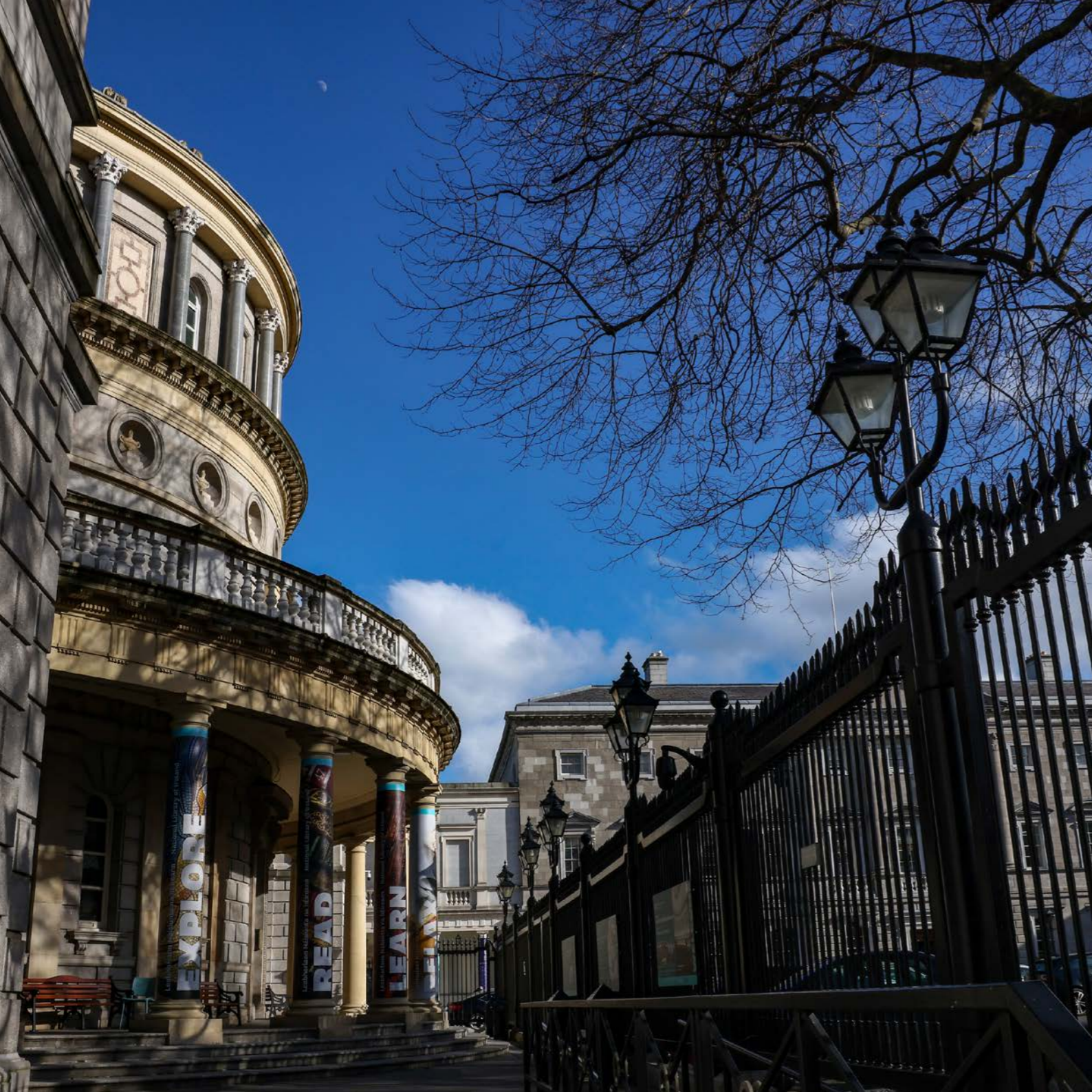
Íomhá: Taobh amuigh de Leabharlann Náisiúnta na hÉireann