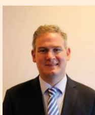
An Seanadóir Seán Kyne Fine Gael