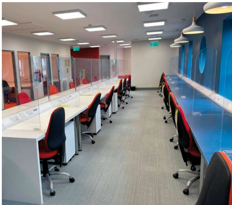
An gteic i nGob an Choire

Is saoráid iontach agus gné bhunúsach agus lárnach de bhonneagar agus de gheilleagar Ghaeltacht Acla é an mol digiteach an gteic i nGob an Choire. Cuireann sé áis iontach agus modh oibre ar fáil don phobal áitiúil, agus d'fhiontraíthe agus d'oibríthe áitiúla. Éascaíonn sé dóibh agus tugann sé an rogha dóibh fanacht agus cur fúthu ina gceantar dúchasach féin, post a fháil ann nó a chruthú dóibh féin in áit bogadh i bhfad ón mbaile sa tóir ar phoist agus deiseanna oibre eile. Cuireann sé deis ar fáil do dhaoine, nár fhág an ceantar riamh agus b'fhéidir a bhíodh ag streachailt le blianta fada gnó a dhéanamh i gceantair thuaithe – in ait a raibh teorainn nó srian leis na háiseanna a bhíonn ag teastáil go hiondúil: modh oibre, cúrsaí leathanbhanta agus nithe eile nach iad. Cuirtear an deis chéanna ar fáil do mhuintir an cheantair – idir óg agus aosta – filleadh ar an bhfód dúchais, iad siúd a chaith tamall de bhlianta lasmuigh den cheantar ach go háirithe i mbun staidéir nó oibre ar siúl ó Ghaeltacht Acla.