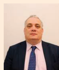
Aengus Ó Snodaigh TD (Cathaoirleach) Sinn Féin