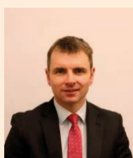
Ruairí Ó Murchú TD Sinn Féin