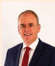
Seosamh Mac Aodha TD Fine Gael