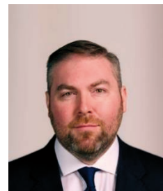
Barra Mac an Bhaird Fine Gael