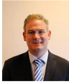
Seán Kyne Fine Gael