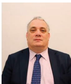
Aengus Ó Snodaigh Cathaoirleach Sinn Féin