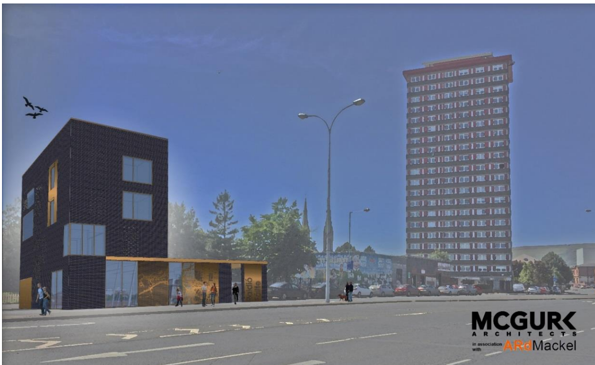
Íomhá ríomhghinte den fhoirgneamh úr Líonra Uladh

Tá an tógáil tosaithe agus tá muid an-bhuíoch as an mhaoiniú a fuair muid ó Chomhairle Cathrach Bhéal Feirste, ó Roinn an Phobail, Tuaisceart Éireann, ón Chiste Infheistíochta Gaeilge agus as an tacaíocht a fuair muid ó Roinn Bonneagair Thuaisceart Éireann agus ó Fheidhmeannacht Tithíochta Thuaisceart Éireann.